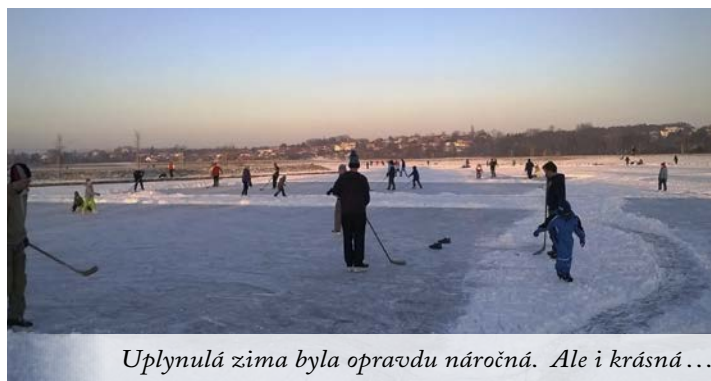
Uplynulá zima byla opravdu náročná. Ale i krásná...